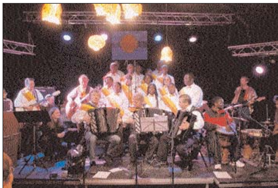
SAMSPILL: Trekkspill, gospelmusikk og folketonar ga en fullsatt sal en flott musikkopplevelse i Boksen under åpningskonserten til Polar Spectacle.