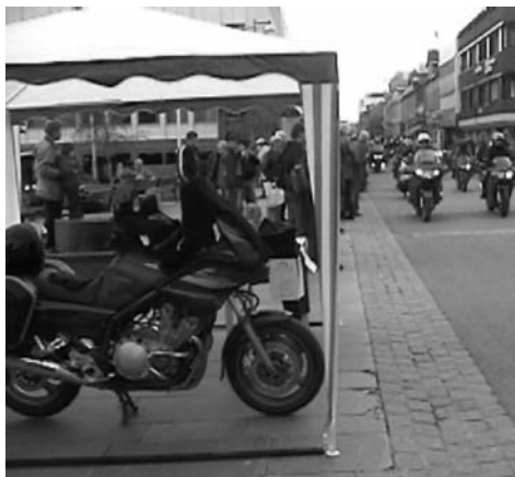
Innkjøring i Storgata